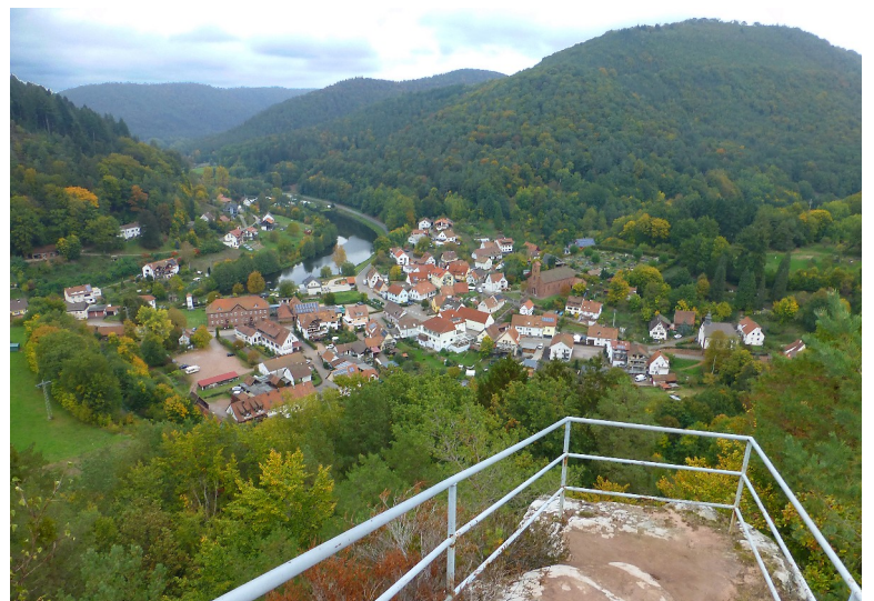
Schönau vom Pfaffenfels