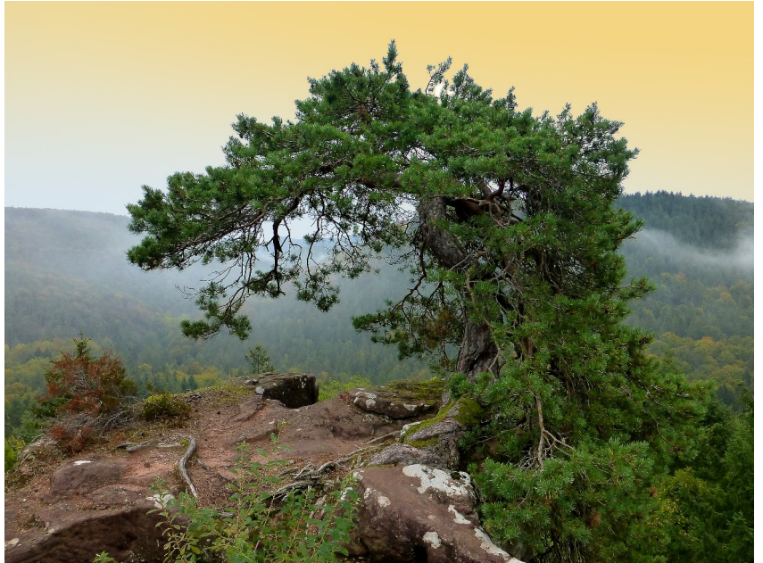
Blumenstein, ganz oben